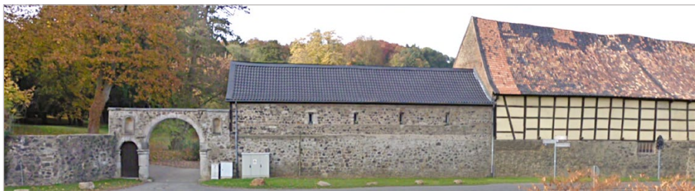
Zufahrt durch den steinernen Torbogen – kommend von Marienforster Straße (rechts) oder von Pecher Straße (links)

Heumarer Dreieck A59 Richtung Bonn; am Kreuz Bonn-Ost auf die A562 Richtung Bad Godesberg; Ausfahrt B9 Richtung Bonn-Bad Godesberg. Vor dem Tunnel links halten in Richtung Bad Godesberg-Mitte/Meckenheim A565. Auf dieser linken Spur durch den Tunnel fahren auf Bonner Straße. Dem Straßenverlauf der Bonner Straße nach rechts folgen und weiter über Aennchenplatz und Burgstraße. Weiter auf die Marienforster Straße. Nach ca. 1 km – erkennbar rechterhand an einem langgestreckten Fachwerkgebäude (Foto) – an der Kreuzung Marienforster Steinweg rechts abbiegen durch den steinernen Torbogen. Das Gebäude der DIS liegt auf der linken Seite den Schotterweg hinauf.